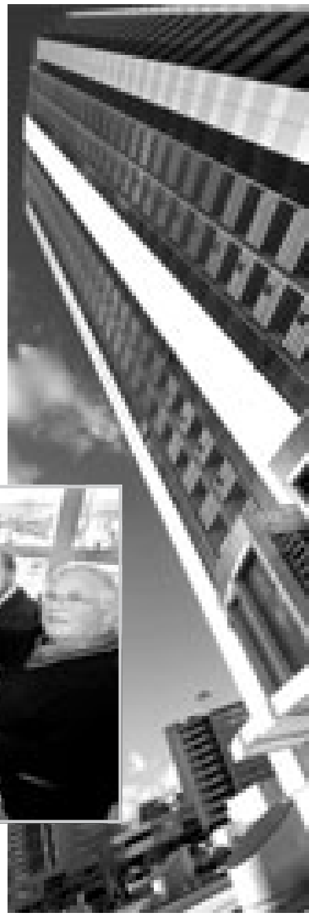
Al tavolo degli ospiti si brinda alla torre e all'impresa riuscita